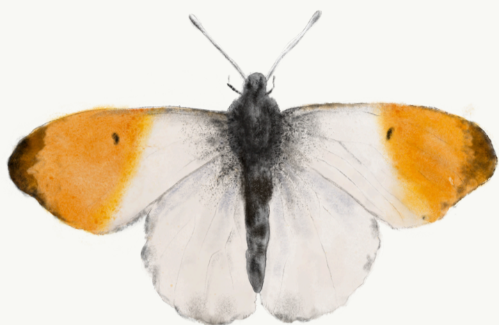
Aurora, han, vingefang 37-47 mm