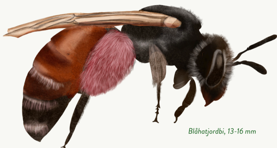
Blåhatjordbi, 13-16 mm