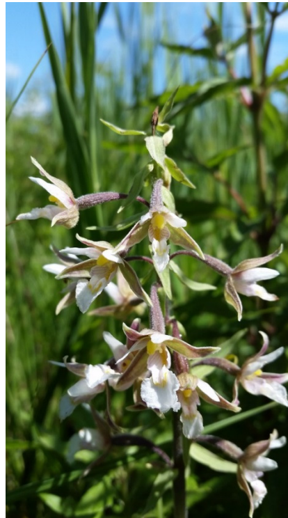
Tre karakter-plantearter fra de store rigkær i Busemarken Mose: Øverst. Smalbladet kæruld. Nederst til venstre: Kødfarvet gøgeurt. Nederst til højre: Sump-hullæbe.