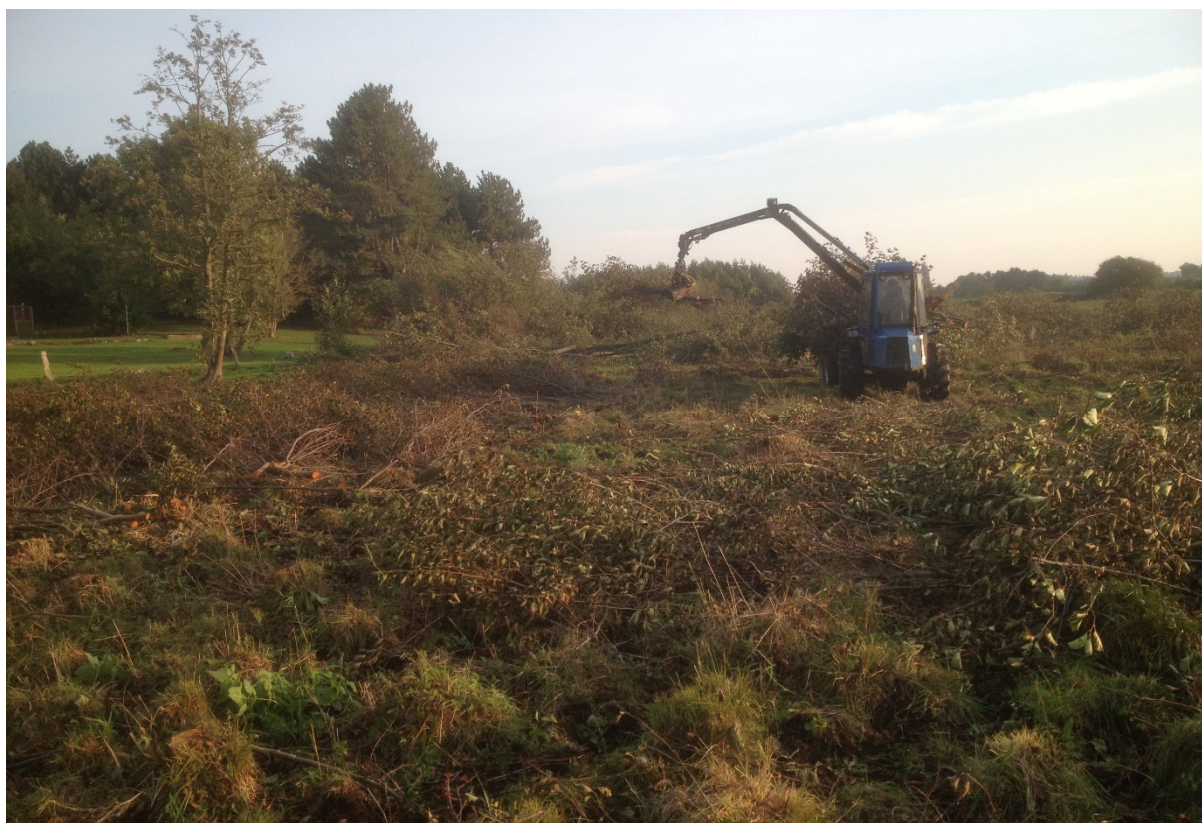
Rydning af rødæl i rigkær. Busemarke Mose, oktober 2014.

Projekterne gennemføres ved frivillige aftaler, og derfor er det i mange tilfælde ikke på nuværende tidspunkt muligt at beskrive hvornår projekterne fysik bliver udført. Kommunen vil i hvert enkelt tilfælde sørge for, at relevante interessenter bliver inddraget.