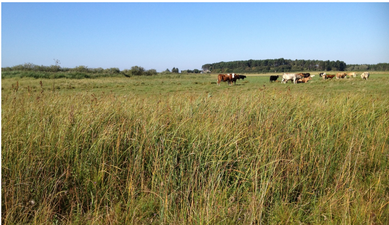
Græssende køer med Hvas Avneknippe i forgrunden. Busemarke Mose, september 2013