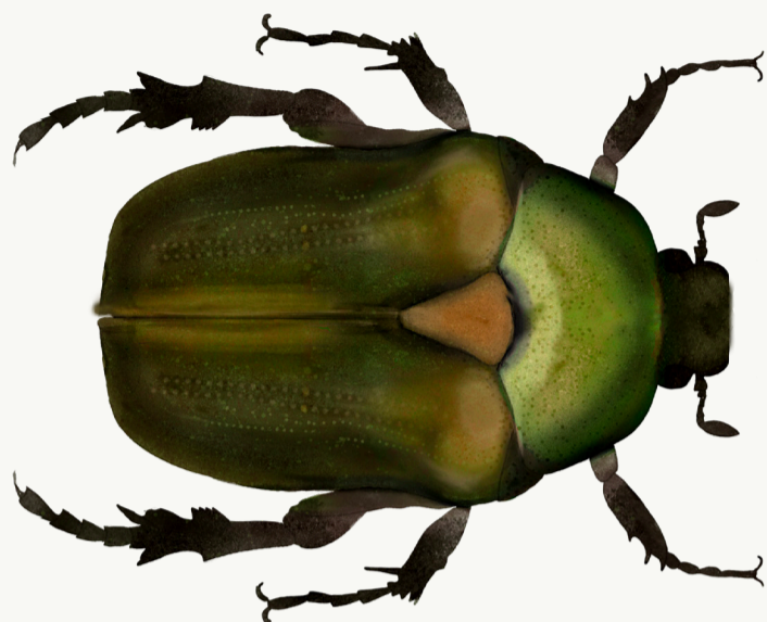
Kobberguldbasse, længde 14-20 mm