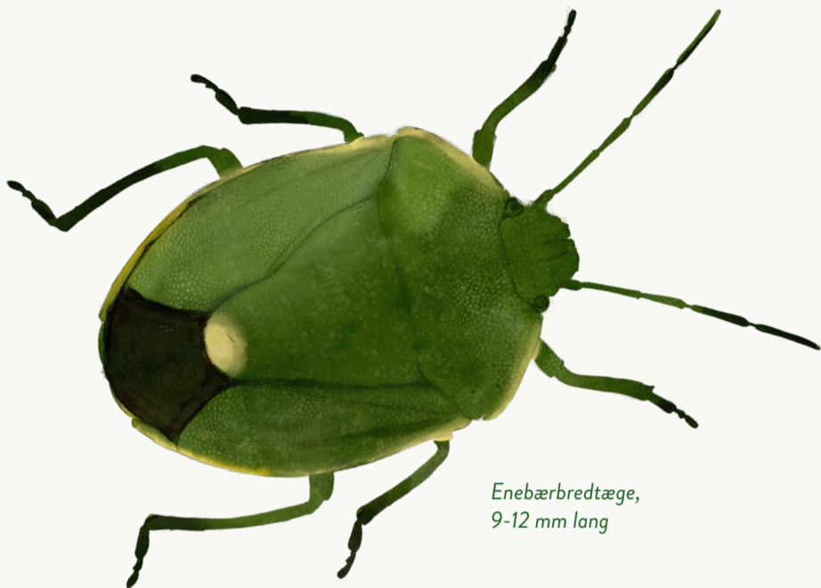
Enebærbredtæge, 9-12 mm lang