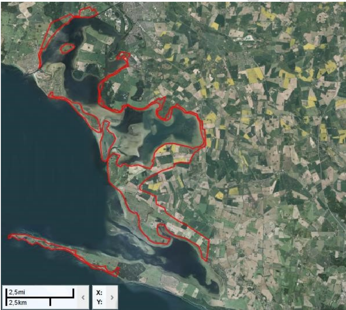
Natura 2000-område nr. 169, med delindsatsområderne Enø-Karrebæk, Gavnø-Vejlø, Svinø-Knudshoved.

Området er delt op i 2 adskilte kommunale projektområder, henholdsvis Næstved Kommune mod nord (Enø-Karrebæk, Gavnø-Vejlø), og Vordingborg Kommune mod syd (Svinø og Knudshoved Odde)