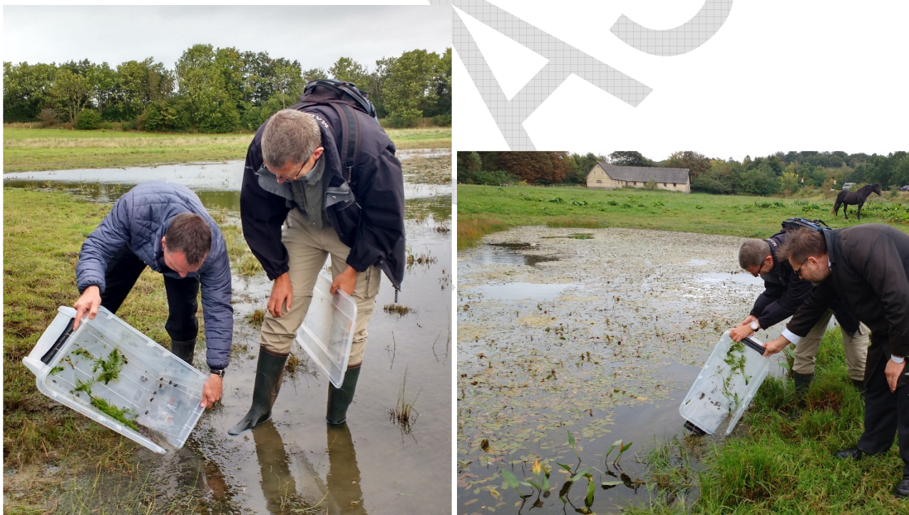
Fotos: Næstved Kommunes udsatte i 2016-21 ca. 2100 ny forvandlede Klokkefrøer ved Rønnebæksholm, som en reservebestand til klokkefrøerne på Enø. Udsætningen er sket i samarbejde med København Zoo og Ravn-Nature

Næstved kommune besluttede derfor i 2014 at lave en reservebestand i på de offentlige arealer ved Rønnebæksholm, indtil forholdene på Enø igen er velegnet for klokkefrøen og de kan genudsættes.