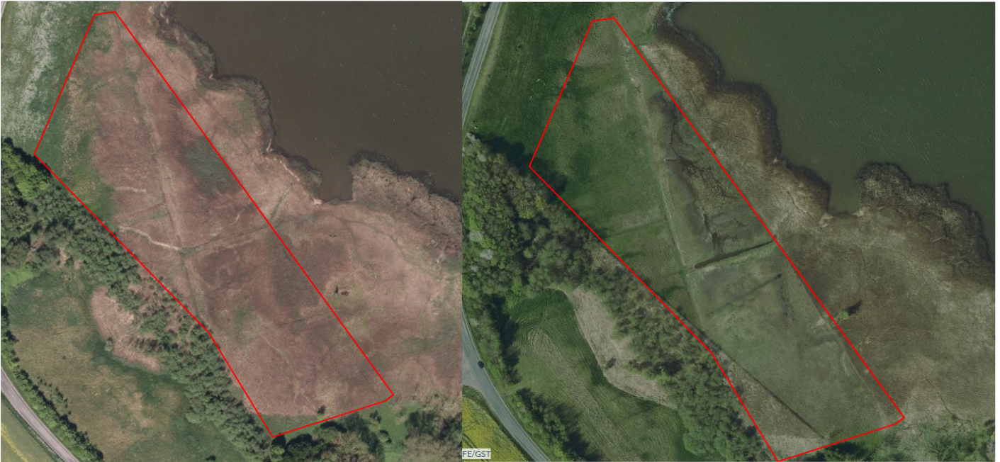
Før og efter foto af udviklingen af strandengsareal ved Stege Nor. Til venstre ses indenfor den røde markering en tilgroet strandeng i dårlig naturtilstand uden græsning. Til højre ses arealet efter udvidelse af hegningen og indførelse græsning, der har medført kort lav vegetation og en strandeng i god naturtilstand.