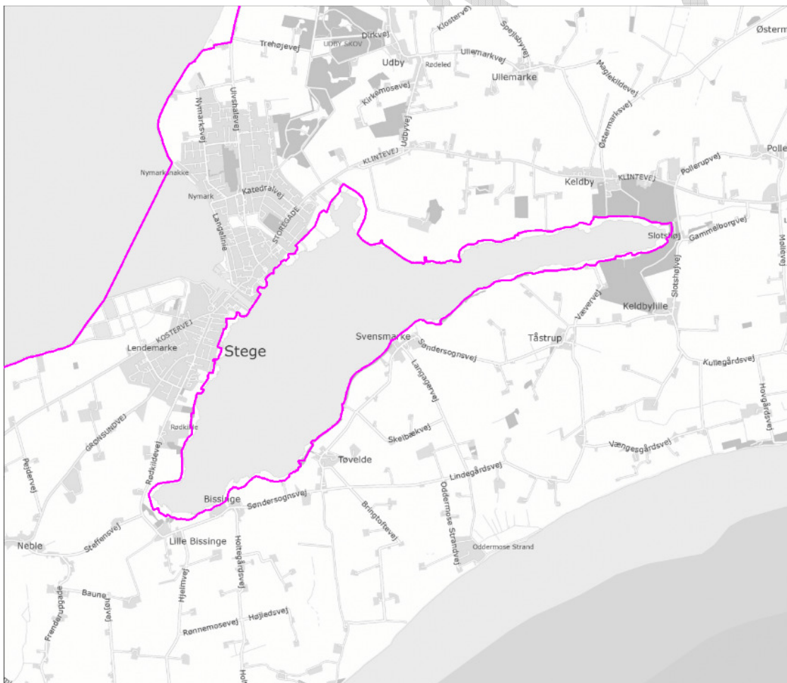
Afgrænsning af Natura 2000-område nr. 180, Stege Nor.

Indsatsen udføres både på private arealer i området. Projekter på private lodsejeres arealer gennemføres i videst muligt omfang gennem frivillige aftaler. Der findes blandt andet en række understøttende tilskudsordninger, som kan søges gennem Landbrugsstyrelsen, samt midler til Life-projekter som medfinansieres af EU.