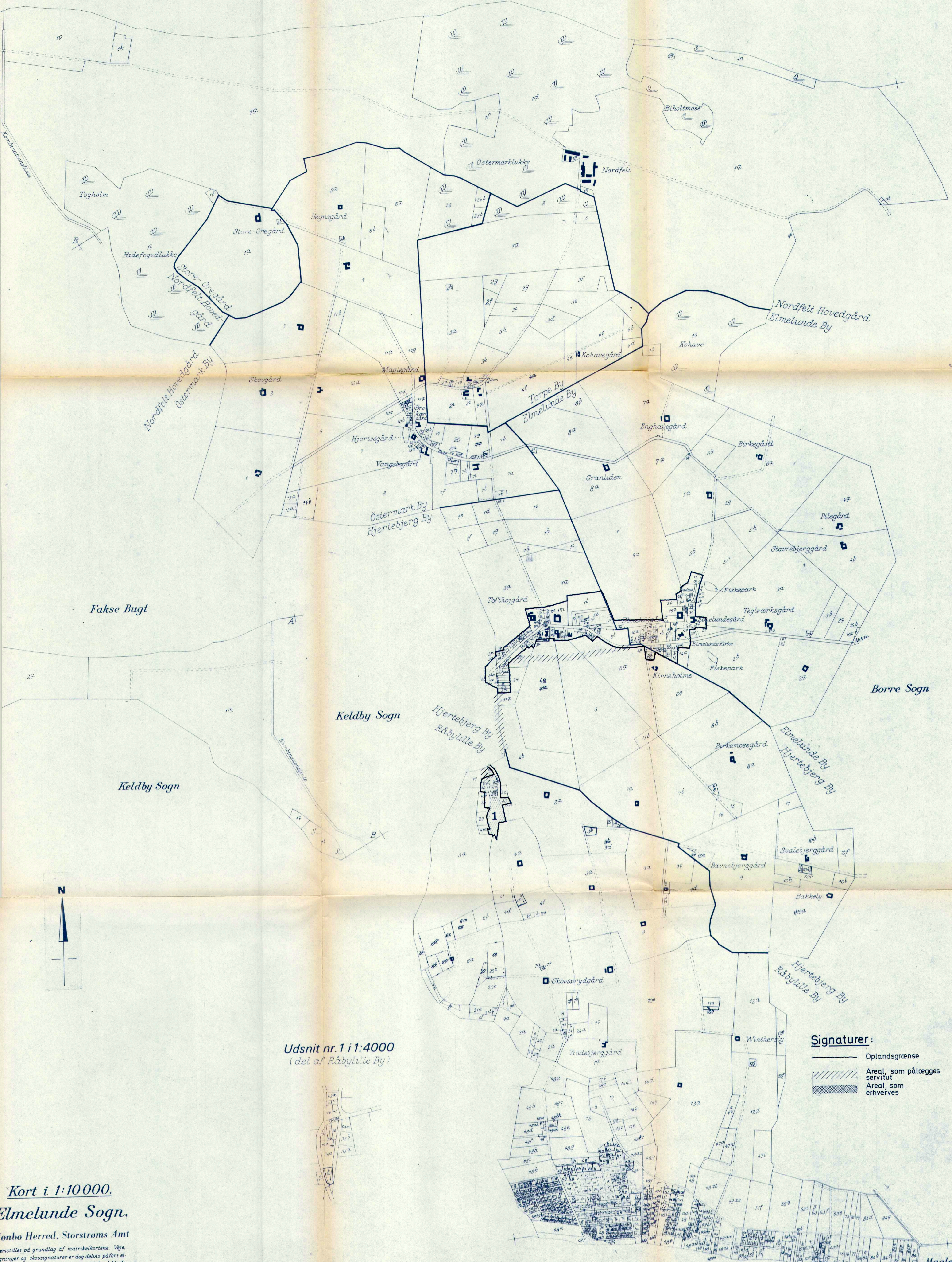
Udsnit nr. 1 i 1:4000 (del af Råbylille By)