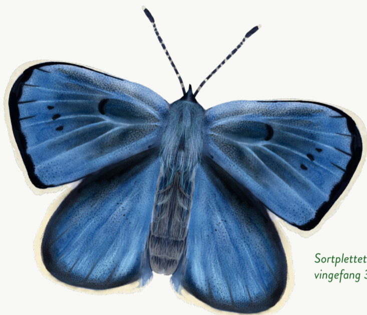
Sortplettet blåfugl, vingefang 32-40 mm