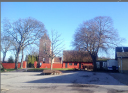
Kirkepladsen i Ørslev