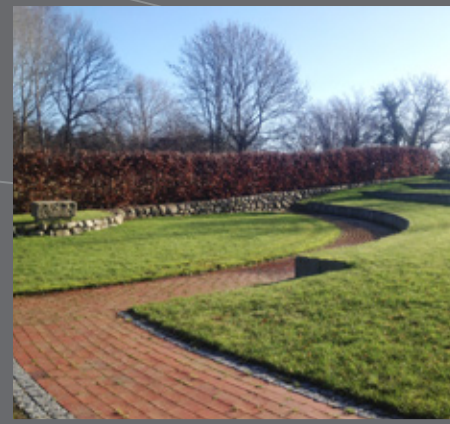
Udekirken i Ørslev