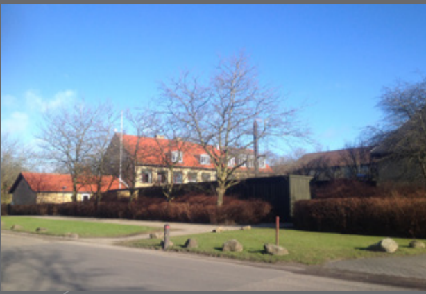
Skolen i Ørslev