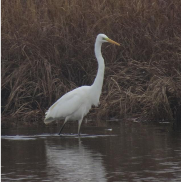
Sølvhejren ses næsten hele året på Nyord