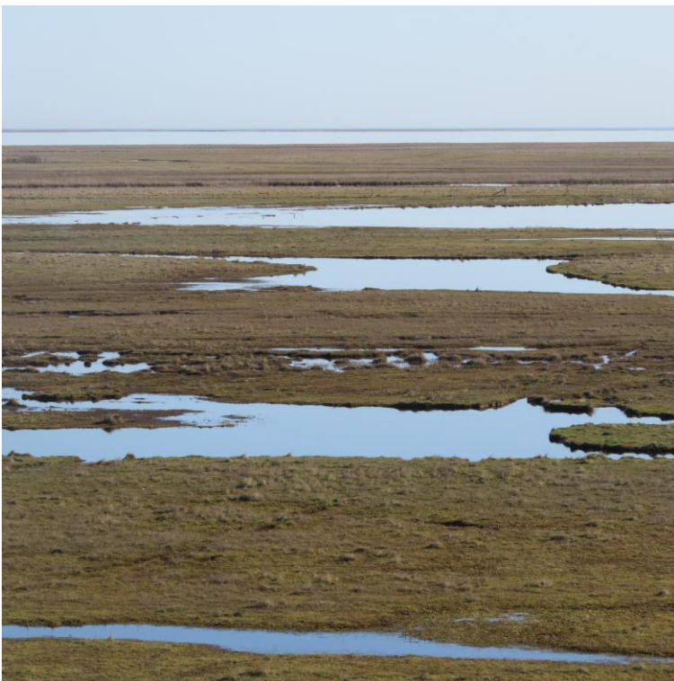
De våde enge i juni

Min optællingsmetode gør det samtidig de seneste sæsoner meget vanskeligt at få en nogenlunde præcis vurdering af antal ynglende Viber og Rødben, da antallet har været kraftigt stigende, og optællingerne viser meget svingende tal gennem sæsonen. Endvidere er jeg i år usikker på, om antallet af ynglende Klyder er urealistisk stort, og om det reelt har drejet sig om ynglende fugle, men optællingsfoto viser rugende Klyder mange nye steder ynglende spredt på engene. Generelt vil det for mig altid være usikkert at fastslå ynglepar i yderområderne, selv om håndkikkert og teleskop nu er af betydelig bedre kvalitet end for 10 år siden.