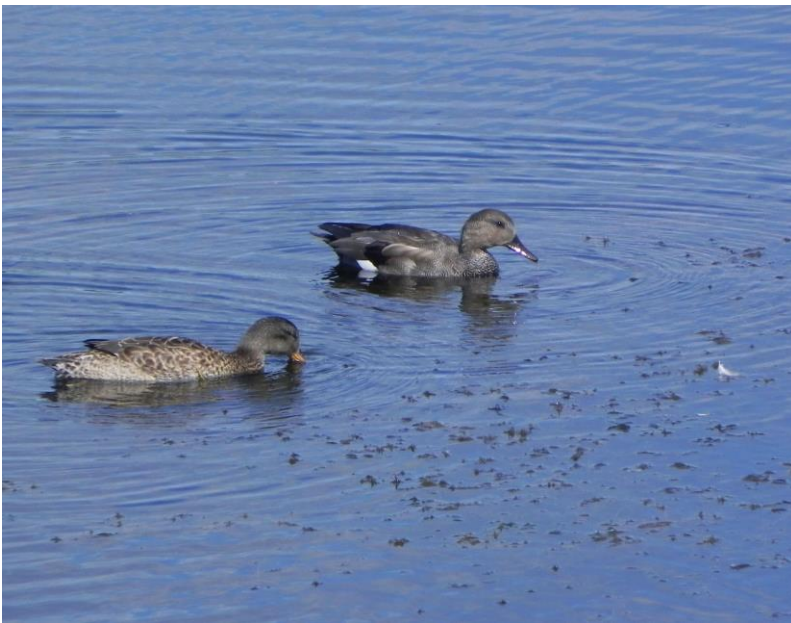
Det fine Knarandepar i en af floderne