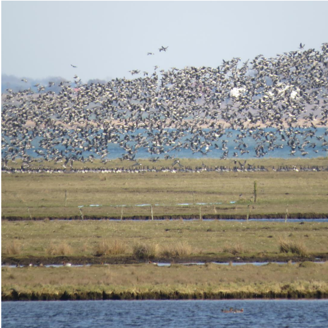
Bramgæs på engene i april

Vordingborg kommune Afdeling for Byg, Land og Miljø