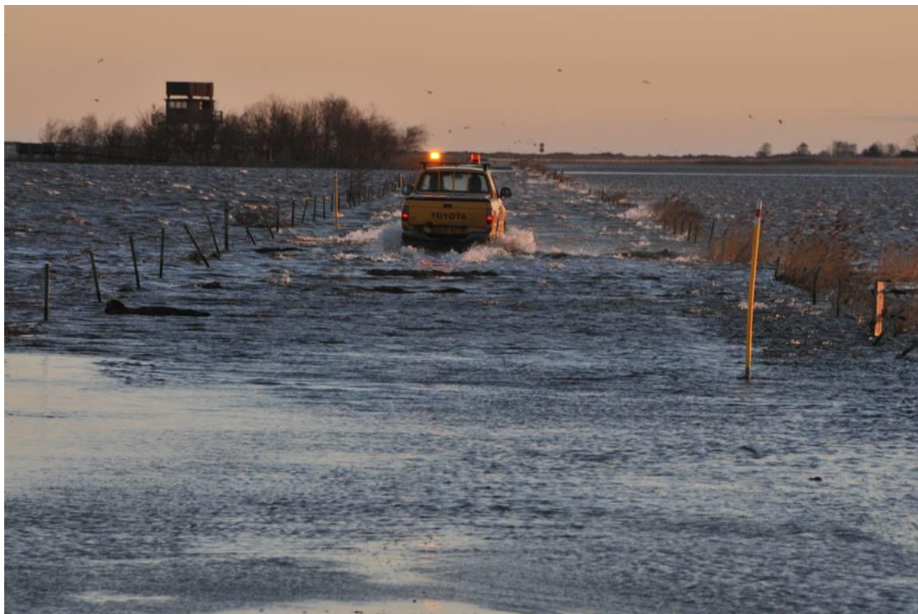
Oversvømmelse 2. januar

Vejret i marts var overvejende gråt med skiftende regn, spredt sol og 4-5 gr.C. Starten af april var med sol og klare dage og frisk vind afløst af enkelte dage midt på måneden med kold vind og lidt sludbyger, men derefter igen sol og klart resten af måneden, op til 8-10 gr.C., og meget lidt nedbør hele måneden. Maj havde skiftende sol, skyer og regn, afløst af soldage i starten af juni og meget kraftige tordenskyer midt på måneden, derefter igen sol, letskyet og plusgrader op til 22-24 gr.C. resten af juni og ind i juli.