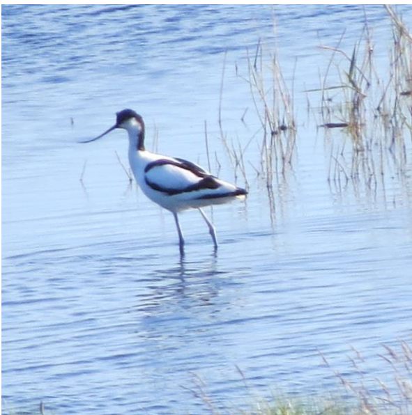
Det glædelige syn af Klyde på engene