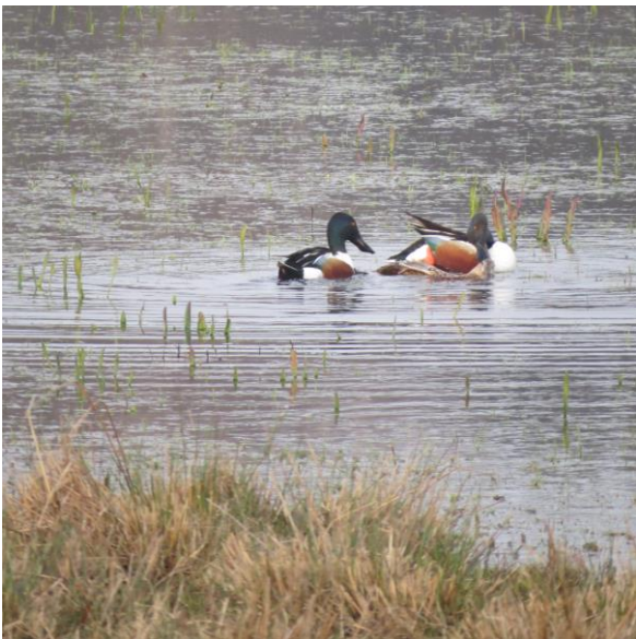
En god sæson for Skeand