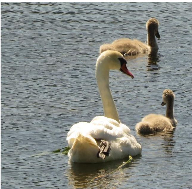
Knopsvane med unger sydkysten 17. maj