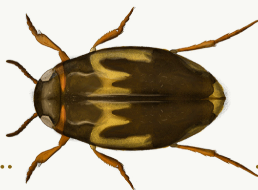
Hydroglyphus, 2-3 mm