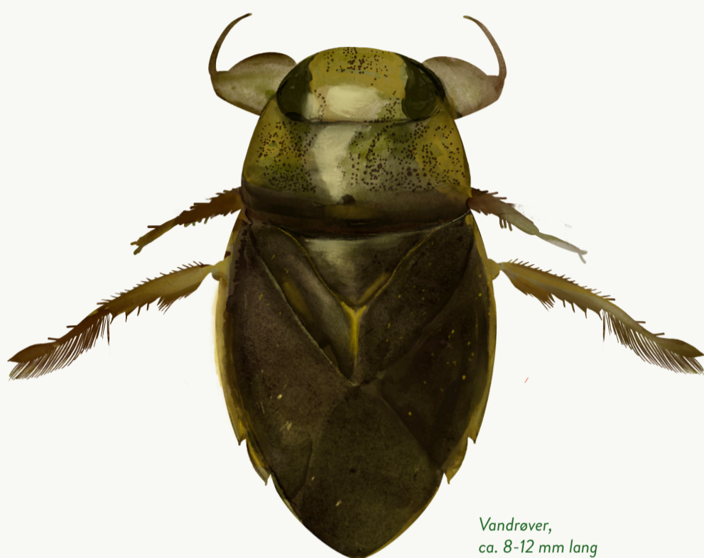
Vandrøver, ca. 8-12 mm lang