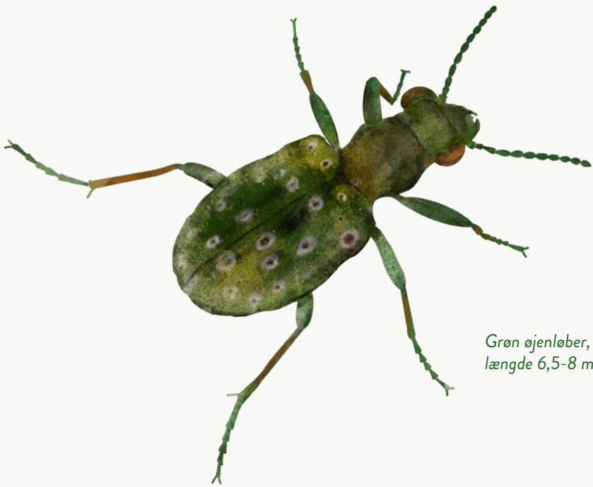
Grøn øjenløber, længde 6,5-8 mm

Der er mere end 300 forskellige arter af løbebiller i Danmark