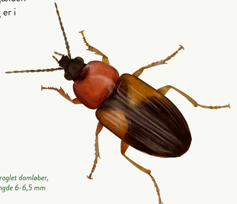
Sraglet damløber, længde 6-6,5 mm