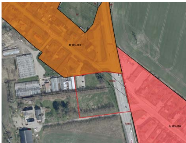
Dagligvarebutikkens placering vest for Næstvedvej - med rød streg er vist det forventede areal, der udtages af åbent-land-rammen.