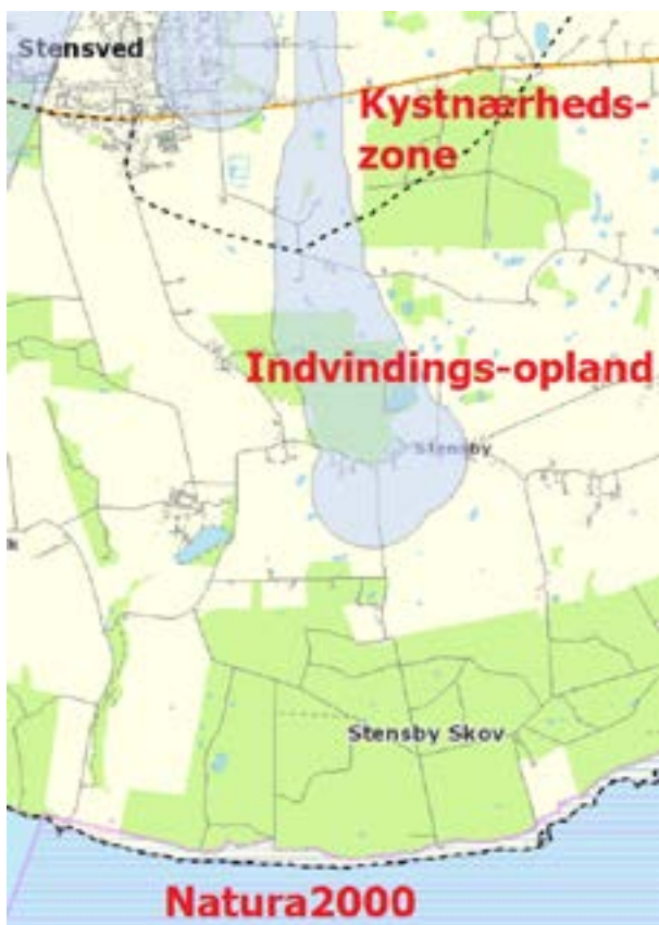
Kystnærhedszone - Sort stiplede linje. Vandindvindingsopland - Lyseblå markering. Natura2000 - Lyserød skravering.