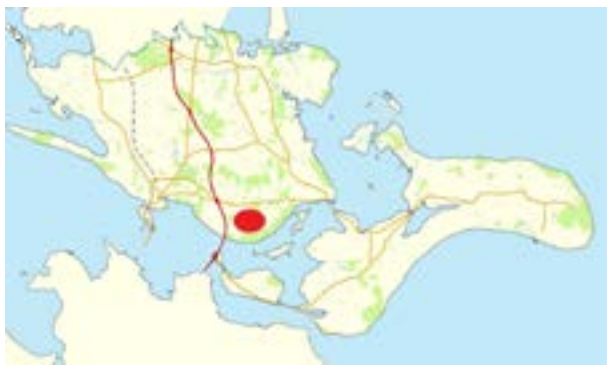
Stensby ligger på Sydsjælland umiddelbart syd for Stensved.