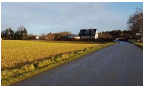
Bebyggelse i den vestlige del af landsbyen, som tidligere har ligget uden for landsbyafgrænsningen.