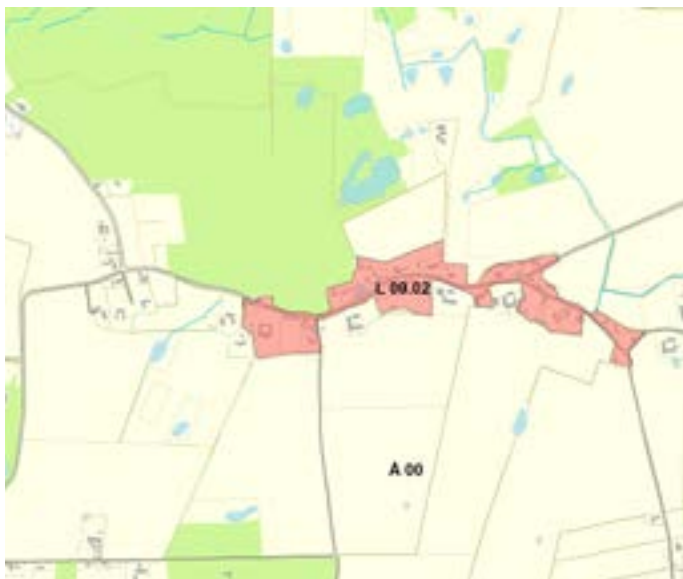
Kommuneplanramme L 09.02 før ændring