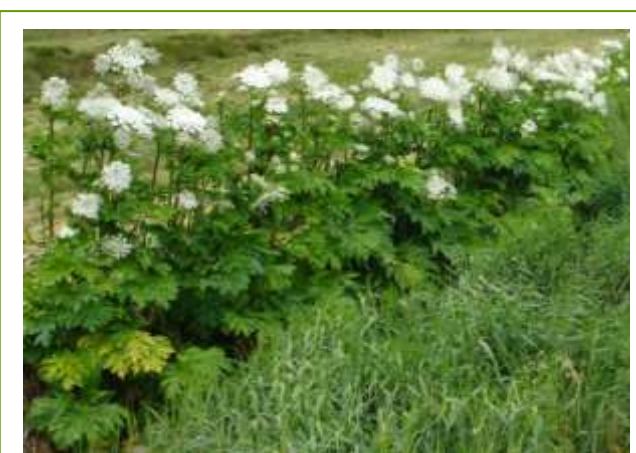
Kæmpe-Bjørneklo langs vandløb

Vordingborg Kommune foretager i dag bekæmpelse af planten på offentlige arealer i lokalområdet.