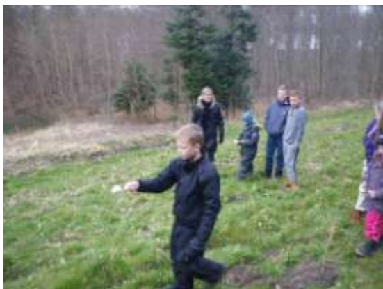
Påskearrangementet ved Beværterhuset

Der har været stor opbakning til turene, og Beværterhuset er blevet mere synlig for lokalbefolkningen. Samarbejdet fortsættes og udvikles.