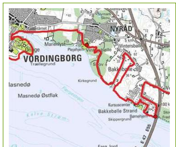
Sjællandsledens forløb gennem lokalområdet