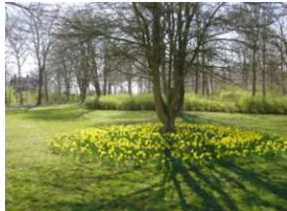
Påskeliljer, Vintersbølle Strand

Den ældre del af parken omkranses af en skovplantning og en nøddegang, og består desuden af en åben, skrånende græsslette og store solitære løvtræer. Under træerne blomstrer et væld af løgplanter i det tidlige forår. Parken gennemskæres af slyngede grusstier, som fortsætter ind i den tilstødende Vintersbølle Skov.