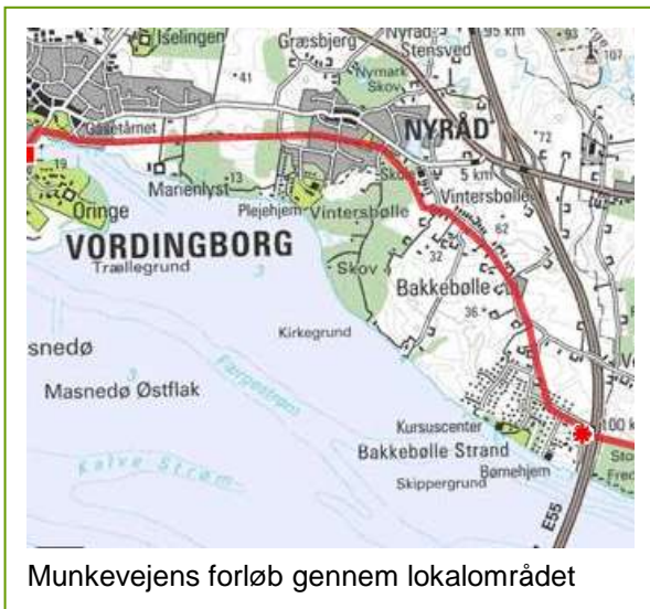
Munkevejens forløb gennem lokalområdet

Ruten formidles på munkevejen.dk , i folder og på informationsstandere ved interessante historiske lokaliteter. Ruten er afmærket ved skiltning.