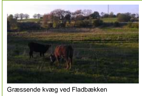
Græssende kvæg ved Fladbækken

I 2011 startede et høslætlaug op, der udfører naturpleje på engen ved Vintersbølle Strand. Lauget mødes årligt og planlægger høslætaktiviteter og evt. sociale arrangementer.