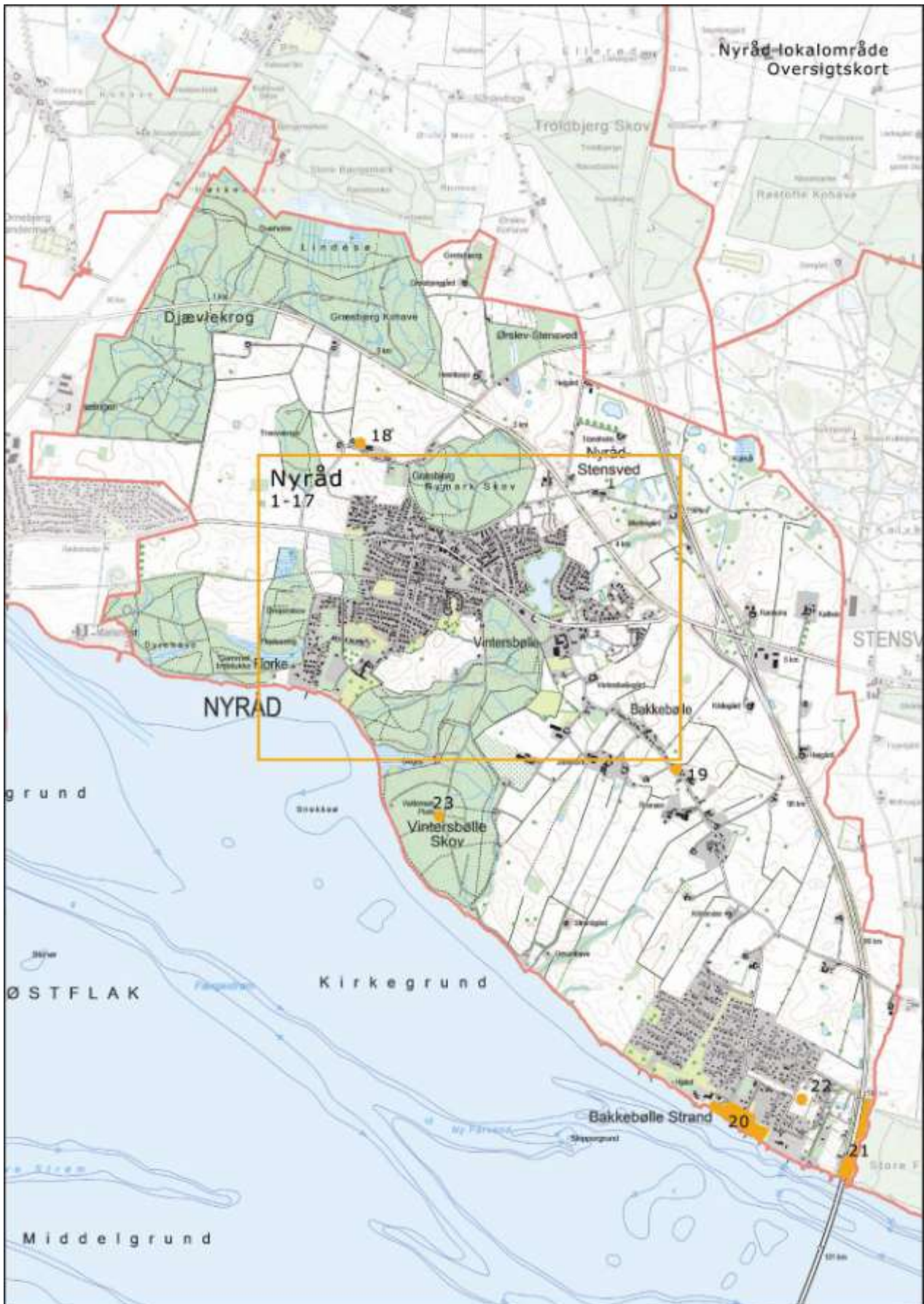
Oversigtskort, Nyråd lokalområde