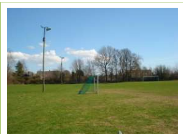
Gl. boldbane, Nyråd

Det levende hegn vedligeholdes, så det stadig giver læ og fungerer som levested for fugle og insekter.