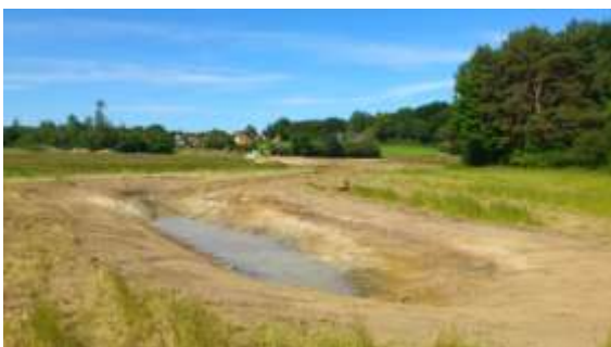
Vintersbølle Overdrev med nyanlagte regnvandssøer

Der udarbejdes en detailplan for arealets videre udvikling med indarbejdelse af de lokale ønsker.