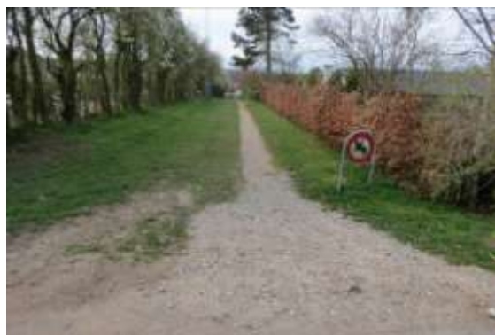
Sti ved Kirsebærplantagen

Beplantningen uddyndes. Vedligeholdelsen af stien fortsætter uændret.