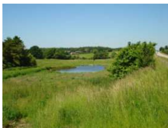
Naturområde ved Fladbækken

En del af dette område afgræsses af kvæg, der passes af Nyråd Kogræsserlaug. I 2012 afgræssede to kvier arealet. Erfaringen viser, at arealet kan bære flere dyr, så der er mulighed for at udvide lauget.