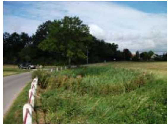
Branddam ved Bakkebøllevej

Der er i øjeblikket ingen rutinemæssig drift på arealet, men branddammen bør naturplejes.