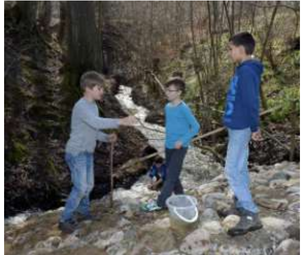
Kommende vandløbsambassadører i aktion ved den nye vandløbsstrækning ved Hasselitten.

Et samarbejde med Hasselitten SFO er igangsat med henblik på at børn udpeges som natur-ambassadører for den nye vandløbsstrækning i SFOens baghave.