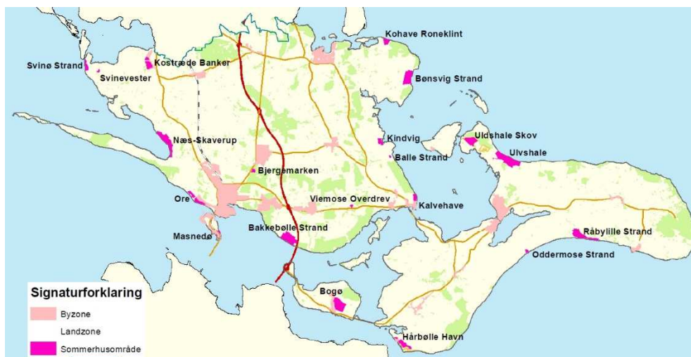
Kort A: Sommerhusområder i Vordingborg Kommune

Ca. halvdelen af sommerhusene er placeret på Møn, hvor hovedparten af de seneste års udbygning af sommerhuse også er foregået. Møn er Vordingborg Kommunes primære turismeområde, og sommerhusene udgør her en væsentlig del af overnatningskapaciteten i kommunen, da en stor andel af sommerhusene på Møn anvendes til udlejning.