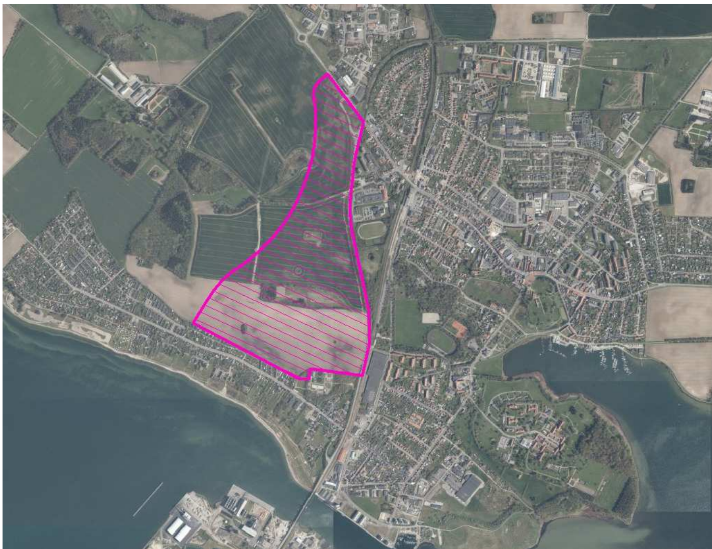
Ønske om udviklingsområde vest for Vordingborg By.

Der er af flere omgange gennem tiden set på udviklingsmuligheden af Vordingborg by mod vest. Spørgsmålet om vækst i denne retning opstår hver gang, der har været tale om placering af større offentlige institutioner i/ved Vordingborg by. De ubebyggede arealer vest for byen er interessante, da de kun ligger 300 meter vest for stationen.