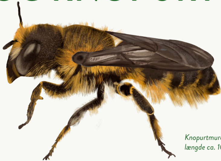
Knopurtmurerbi. længde ca. 10 mm