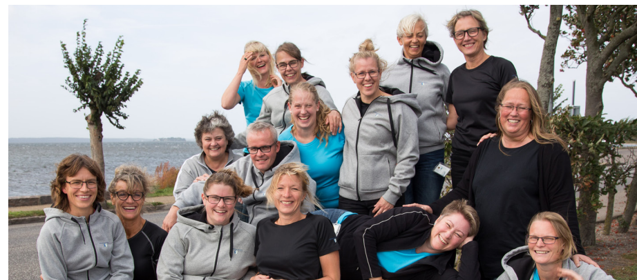
En del af patientteamet