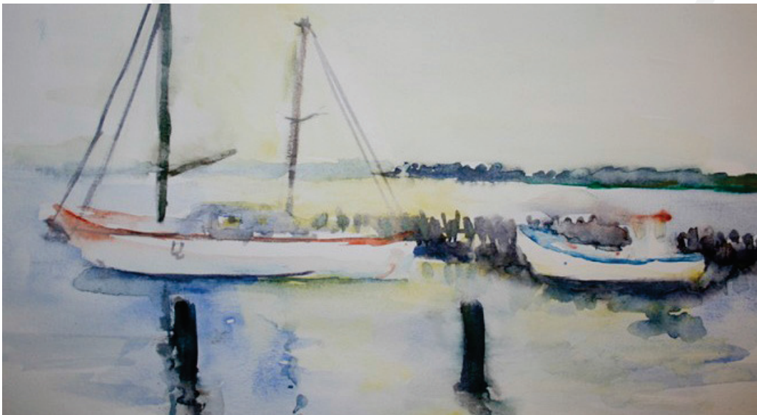
Illustration René Lundby

For afgifter opkrævet af havnefogederne eller kommunen 2015 gældende takster.