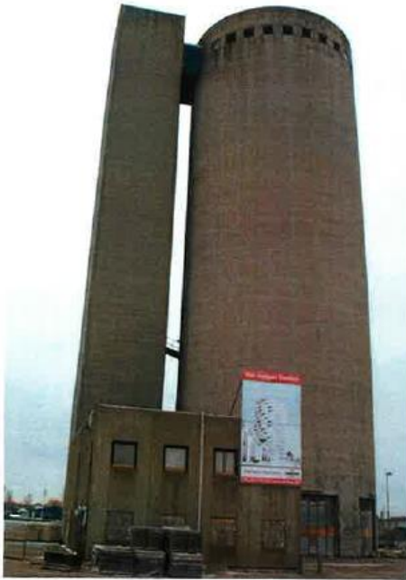
Siloen som vi kender den