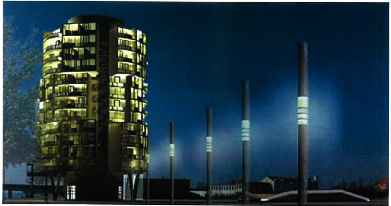
Lejlighedsprojekt 2006 – H. 53 m. – Ø 40 m.