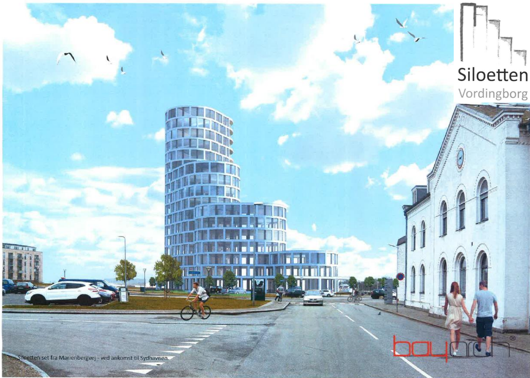
Siloetten set fra Marienbergvej - ved ankomst til Sydhavnen