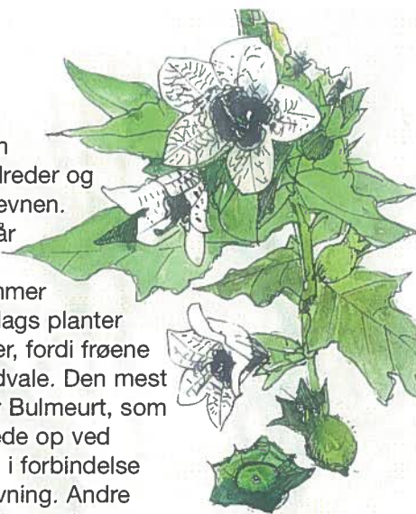
Bulmeurt er en dvaleplante som pludseligt - efter flere hundrede års dvale - kan dukke op, når der rodes i jorden.