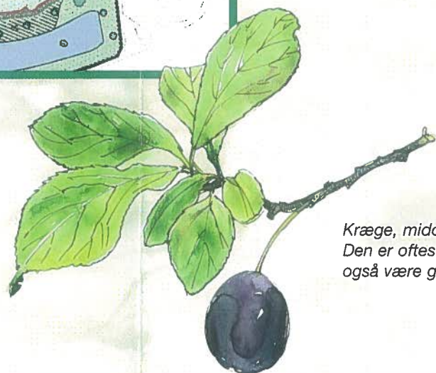
Kræge, middelalderens blomme. Den er oftest mørkeblå, men kan også være grønlig eller gul.

Krægen er middelalderens blomme - altid af dejlig, sød smag.